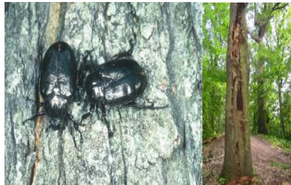
Links: Eremit – eine faunistische Besonderheit Rechts: entsprechender Lebensraum in Mulmhöhlen einer alten Eiche

Das Gebiet zeichnet sich durch seinen sehr hohen Waldanteil (93%) aus. Nutzungsgeschichtlich bedingt sind die von vielen Alteichen und Altbuchen durchsetzten Wälder vom Nadelholz, v.a. von der Kiefer geprägt, jedoch in starkem Wandel hin zu naturnahen, sehr laubholzreichen Mischbeständen begriffen. Der dadurch bedingte Strukturreichtum gewährt vielen Tier- und Pflanzenarten Lebensraum. Besondere Bedeutung hat das Gebiet für den Erhalt des seltenen Eremiten, eines in Mulmhöhlen sehr alter Laubbäume lebenden Käfers und der Bechsteinfledermaus. Eine Vielzahl anderer Insekten, Vögel (v.a. Spechte, Eulen und andere Höhlenbrüter) und viele Pilzarten sind ebenfalls auf den Strukturreichtum des Gebietes mit einem hohen Anteil alter und abgestorbener Bäume angewiesen. Das Gebiet hat - wie schon seit Jahrhunderten - große Bedeutung als bevorzugtes Erholungsgebiet der Stadtbevölkerung.