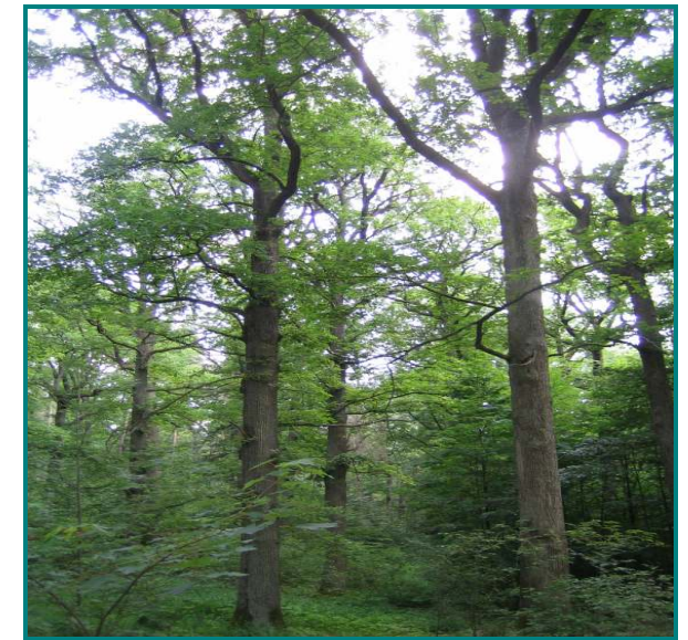
Unten: Alter Eichenbestand – Lebensraum der geschützten FFH- Arten Bechsteinfledermaus und Eremit sowie vieler anderer Tier- und Pflanzenarten