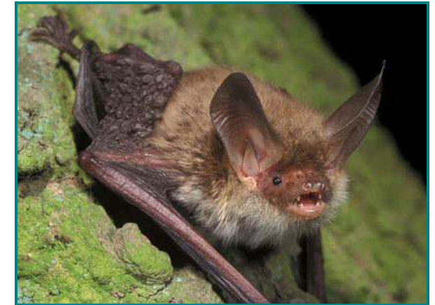
Oben: Bechsteinfledermaus. Sie ist auf alte Laubbäume mit Höhlen – wie es sie rund um den Schmausenbuck noch reichlich gibt - angewiesen