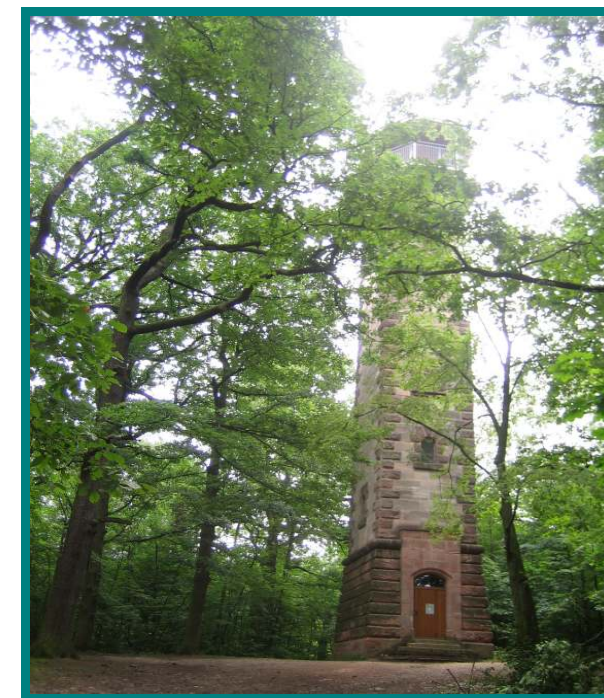
Aussichtsturm auf dem Schmausenbuck